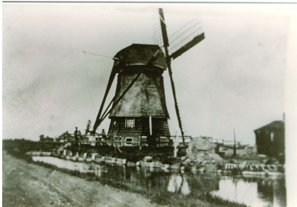
De Hempoldermolen ook wel Stremmermolen genoemd.

Ter hoogte van de Hemweg vormt de afstand Boschweg-Koningsweg de totale breedte van de oostelijke strandwal. De boerderijen liggen nog op het zand, maar hun weilanden liggen in de lage delen. Vanaf de Sluisweg ga je naar beneden over de smalle strandvlakte, het zuidelijke deel van de Binnengeesterpolder in. Hier is goed te zien dat het grasland tussen de twee strandwallen ligt.