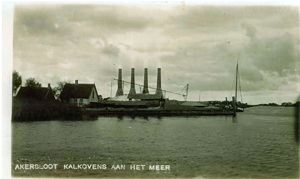
Zicht op 't Stet met kalkovens van de firma Ruigewaard.