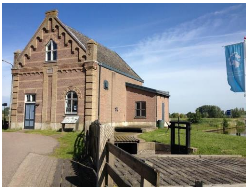
Gemaal 1879 https://www.hollandbovenamsterdam.com/